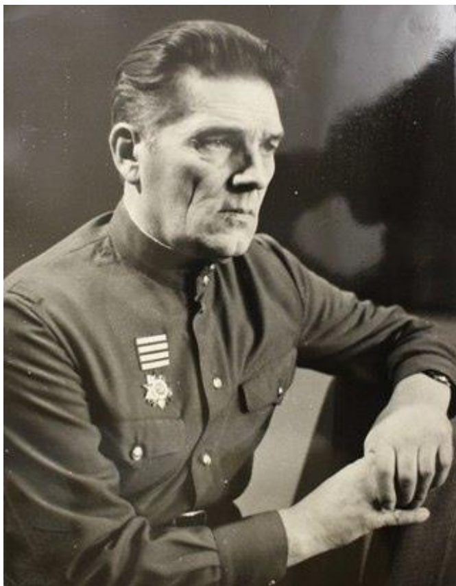
Игор Н. Григорјев – песник и борац